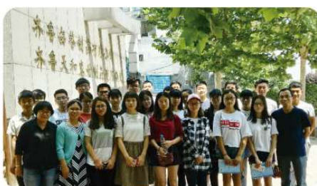
学生就业齐鲁制药