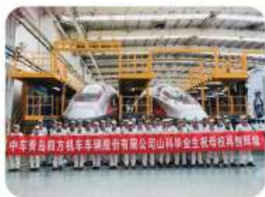
学生就业中国中车

学院携手中国中车、一汽-大众、潍柴动力、烟台万华、齐鲁制药、鲁泰集团、歌尔股份、联想集团等 500 余家龙头骨干企业构建起产学研协同育人的工作平台，签订校企合作协议千余份，建立校外产学研实践基地，开展多方位、多样化的校企合作。每年举办各种形式的大型综合招聘会、多场次小型专业招聘会和就业专场宣讲会，毕业生与岗位的供需比一直保持在 1: 6 以上。毕业生初次就业率连年保持在 98% 以上，30% 就业于中国中车、一汽大众、齐鲁制药、中铁建、中建港集团等品牌大企业。呈现出“高就业率、高就业质量、高就业满意度”的可喜局面。