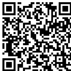
学院 VR 全景校园