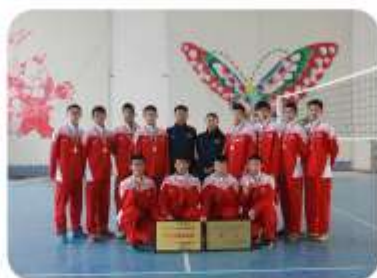
我院男排连续三年获得山东省“体协杯”排球赛冠军