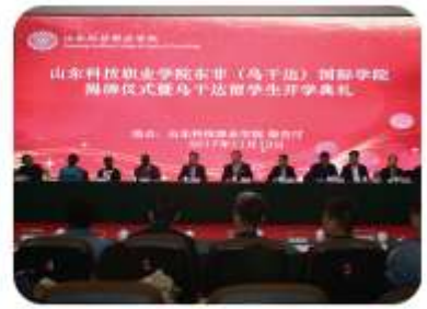
东非(乌干达)国际学院揭牌仪式