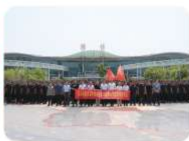
我院818名志愿者服务2018年上合峰会