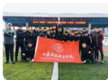
我院荣获2019年全国青少年校园足球联赛(大学组)山东省预选赛冠军