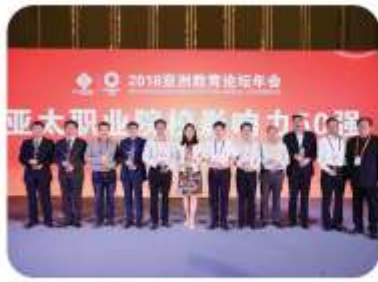
我院荣获“亚太职业院校 影响力50强”称号