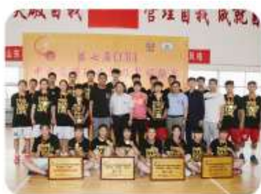
我院男、女篮参加第七届CCBA全国高职篮球锦标赛北区比赛双获冠军

级比赛冠军，跆拳道队连续 9 年参加全国大学生跆拳道锦标赛共获得 34 金 13 银 14 铜，居全国高职院校首位。学生舞狮队、武术队应邀赴德国参加“中国民俗文化节”巡演。