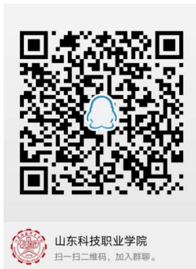
学院招生 QQ 群