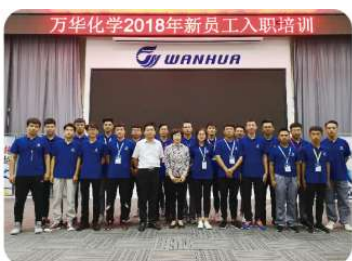
学生就业烟台万华