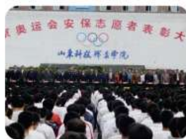
我院3000名志愿者服务2008年北京奥运会