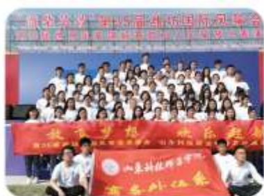
我院学生担任潍坊国际风筝会志愿者