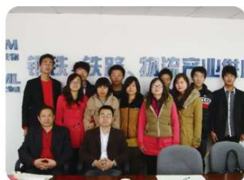
学生就业中铁物流