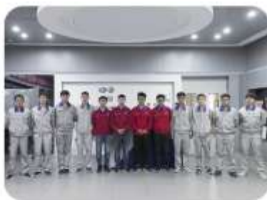
学生就业一汽-大众