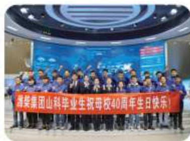
学生就业潍柴动力